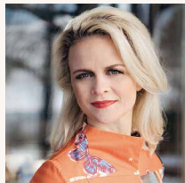
IVETA APKALNA